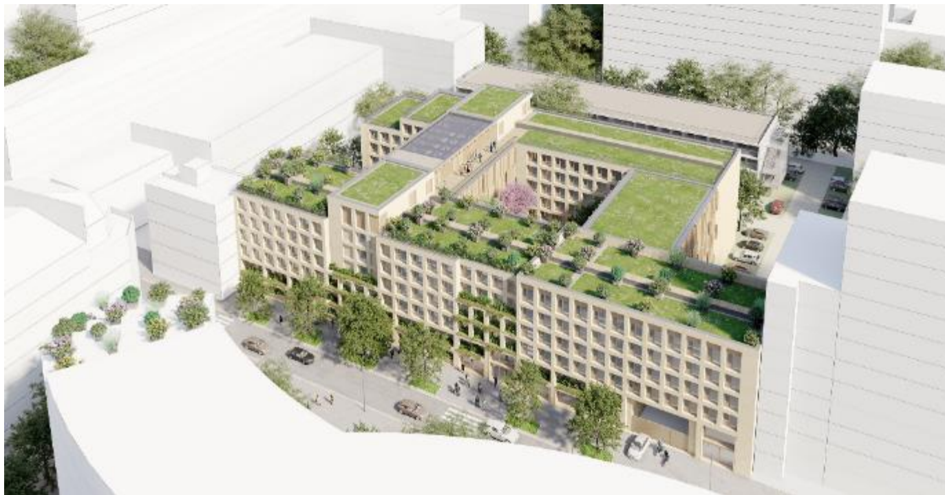
Vue perspective présentée dans le cadre du concours

Recréer le dialogue avec la rue Miollis par l'animation du rez-de-chaussée et la requalification des vis-à-vis.